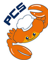
Tabla de Control de Alérgenos: